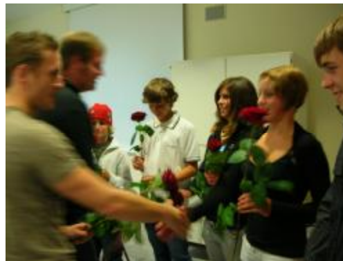
Übergabe der Ämter der Vorgängergeneration an die neue Generation

Vertreten werden die Jugendlichen von einem demokratisch gewählten Jugendrat . Ca. alle 2-3 Jahre wird der Jugendrat in einer groß angelegten Jugendratswahl unter der Leitung des vorher amtierenden Jugendrates zusammen mit dem Bürgermeister mit einer anonymen Wahl gewählt. Die ehemaligen Jugendratsmitglieder stehen dann als Jugendsenat für die Fragen der neu gewählten Räte im Hintergrund zur Verfügung und helfen in der Übergangszeit.