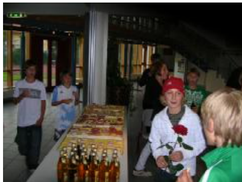
Nach der Jugendratswahl