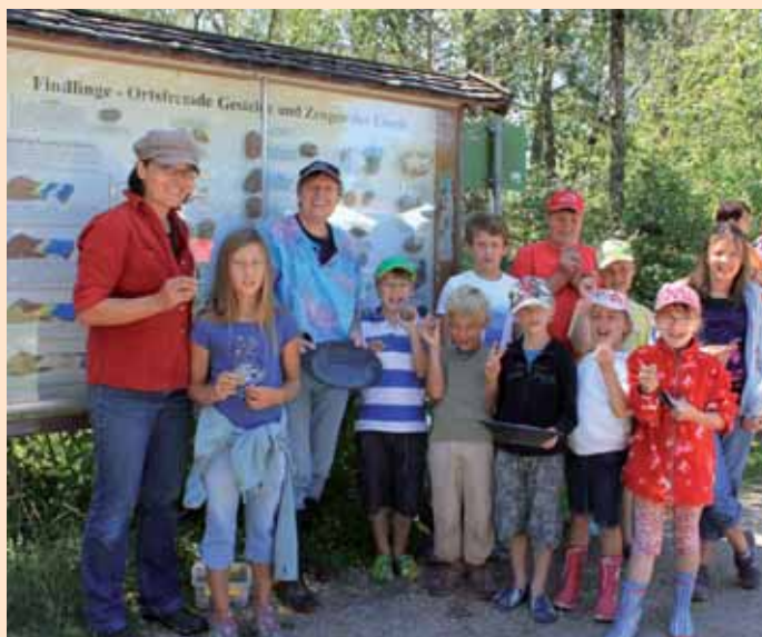
Die Kleinen bestaunten die Gesteine der Eiszeit.

Das Ferienbüro bedankt sich bei allen Teilnehmern für's Mitmachen, den aktiven Betreuern und Programmgestaltern, sowie den Vereinen, ganz herzlich für die Unterstützung und verabschiedet sich für dieses Jahr.