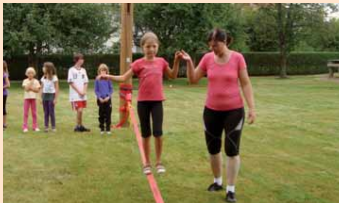
Die Slackline - Ein wahrer Balanceakt.