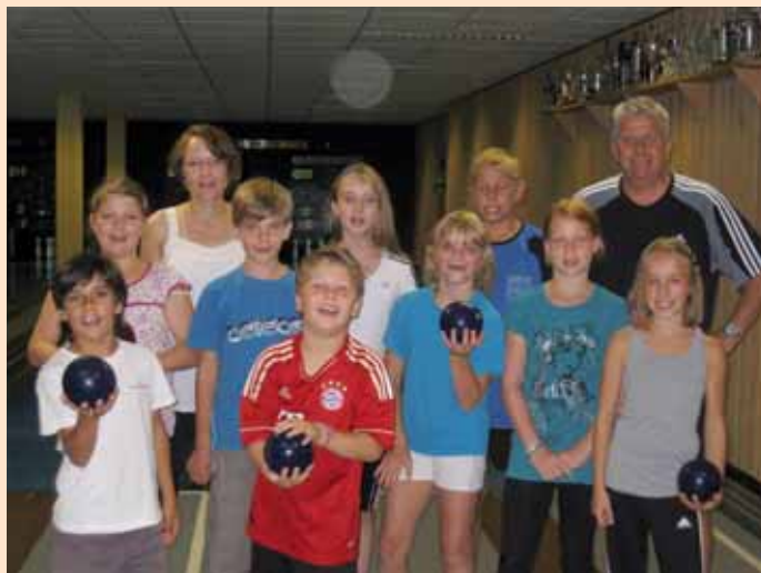
„Alle Neune“ - Gute Laune mein Kegeln.