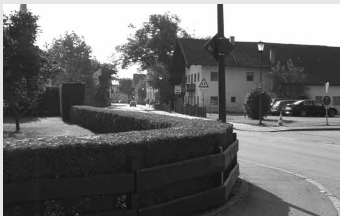
Vorbildlich gestutzte Hecke an der Hauptstraße.

Der Ordnung halber weist die Gemeinde Eggstätt darauf hin, daß gemäß Artikel 29 des Bayerischen Straßen- und Wegegesetzes eine Verpflichtung zur Beseitigung dieser Behinderungen besteht und die