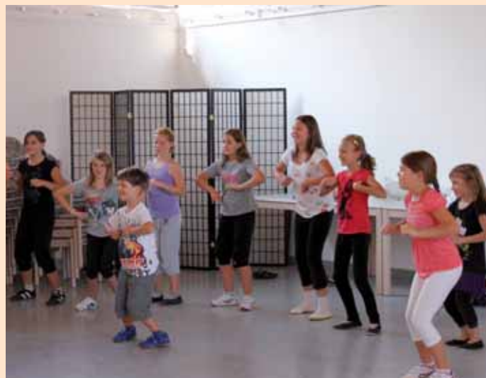
Die ersten Schritte zur gemeinsamen Choreografie.