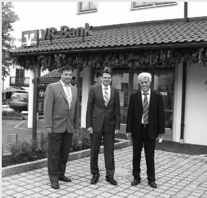
Auf Initiative der Projektgruppe „Tourismus für Alle“ konnte nun der Parkplatz vor der Volksbank-Raiffeisenbank in Eggstätt barrierefrei gestaltet werden.