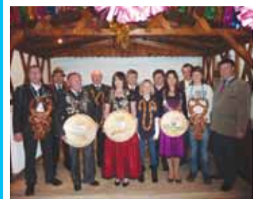
Königswürde der Jungschützen

Der Frühling überraschte mit sommerlichen Temperaturen und inspirierte zur aktiven Freizeitgestaltung. Wenn das Wetter weiterhin mitspielt, dann ist es an der Zeit die bunte Farbenwelt der Natur zu genießen, den Grill anzuzünden und die Nachmittage im Biergarten zu verbringen.