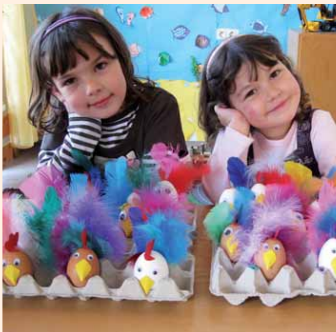
Stolz präsentieren die Kleinen die selbstgebastelten und bunten Ostergockel.