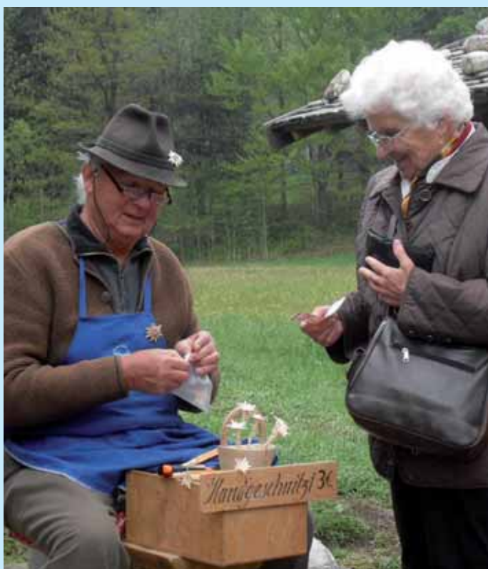
Fanni und der Edelweißschnitzer.

Wir erhielten genaue Angaben zur Herkunft der Höfe und einen kleinen Einblick in das Leben der Bauer's Leute von früher. Zum Mittagessen kehrten wir beim "Wofen" ein. Die Weiterfahrt führte uns nach Tegernsee zur ehemaligen