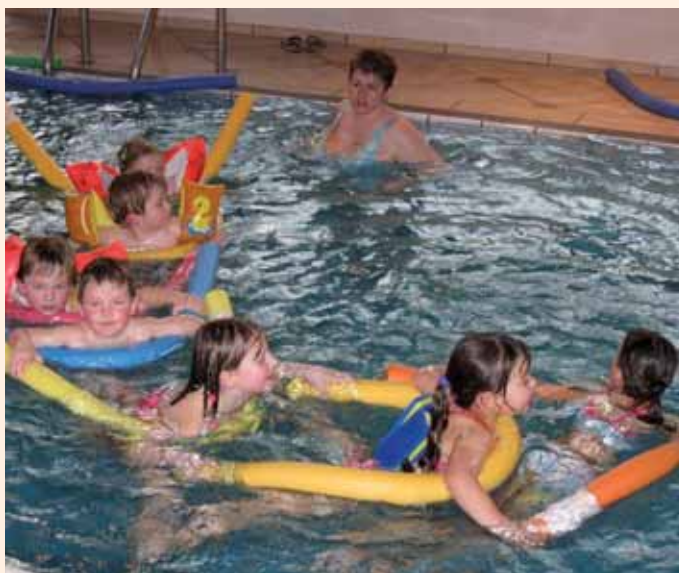
Mit großer Begeisterung sammelten die Kleinen erste Erfahrungen beim Schwimmkurs im „Kurfer Hof“.