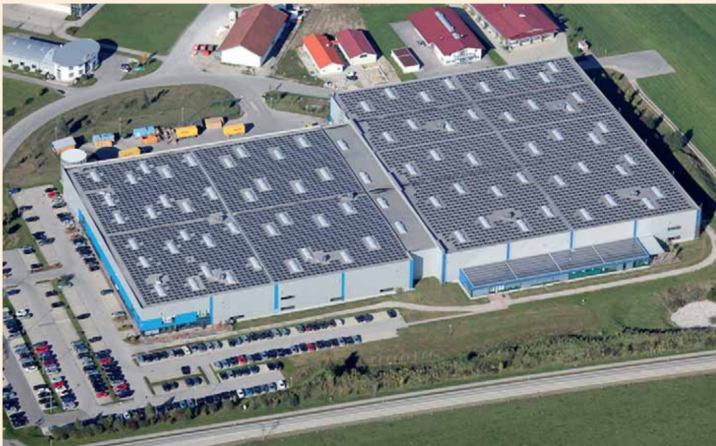
Luftaufnahme der Photovoltaik-Großanlage (vier Fußballfelder) auf dem Dach des FESCO-Gebäudes.

Auf den Flachdächern der FESCO GmbH in Eggstätt wurde eine Photovoltaik-Großanlage mit einer Nennleistung von rund 1.200 kWp von der Fa. Max-Solar errichtet.