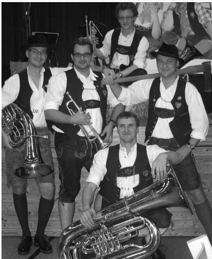
Die Hartseemusikanten beim musikalischen Stelldichein.

Die „Hartseemusi“ war zum Musikantentreffen in Sickenhausen (Baden Württemberg) eingeladen.