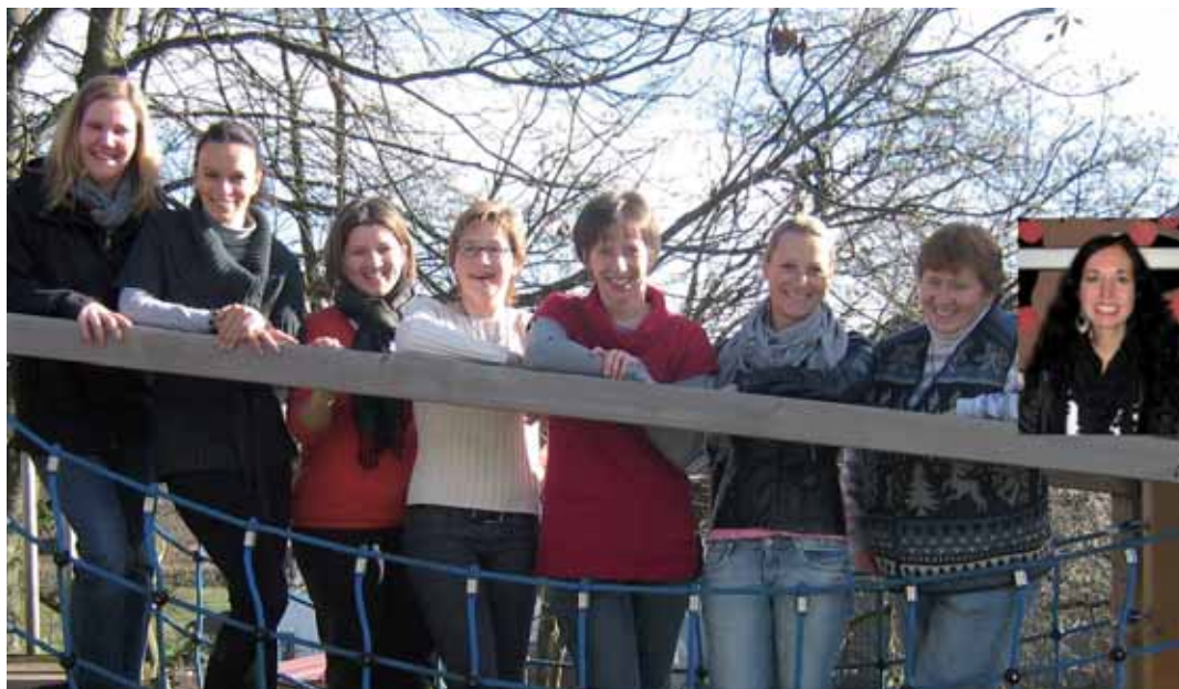
Der neu gewählte Elternbeirat des kath. Kindergartens St. Georg.

Die Initiative KiTa-Spielothek möchte spielerisch die Entwicklung von Kindergartenkindern fördern, Erziehungspartnerschaften zwischen Eltern und Erziehern unterstützen und die Spielkultur wieder stärken. Das Besondere an der Idee: Die Kindergartenkinder dürfen ihre Lieblingsspiele aus dem Kindergarten ausleihen und mit nach Hause nehmen, um sie dort gemeinsam mit der Familie auszuprobieren.