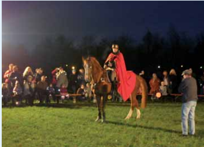
Gespannt schauten die Kinder der beiden Kindergärten mit ihren Liebsten dem Schauspiel zu.