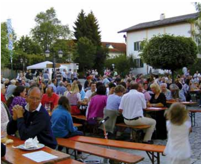
Gemütliches Beisammensein am Rathausplatz.