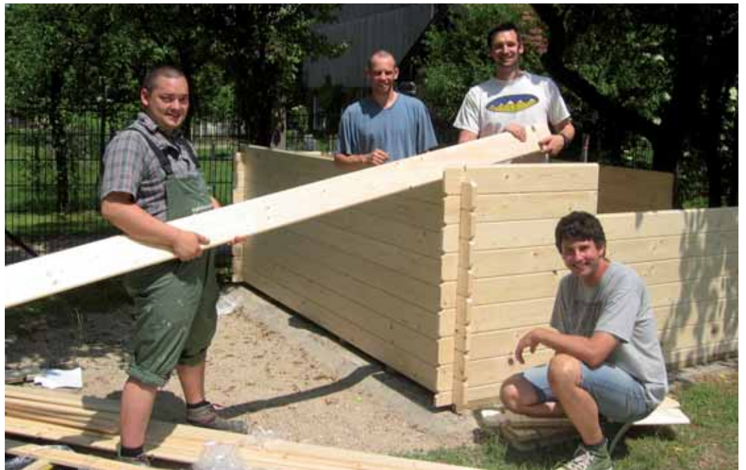
Die fleissigen Papis bauten bei herrlichen Wetter das Gartenhäusl der Kleinen auf...

Nach einem Fackellauf mit dem Entzünden des olympischen Feuers, einer festlichen Eröffnungsrede durch den Elternbeiratsvorsitzen-