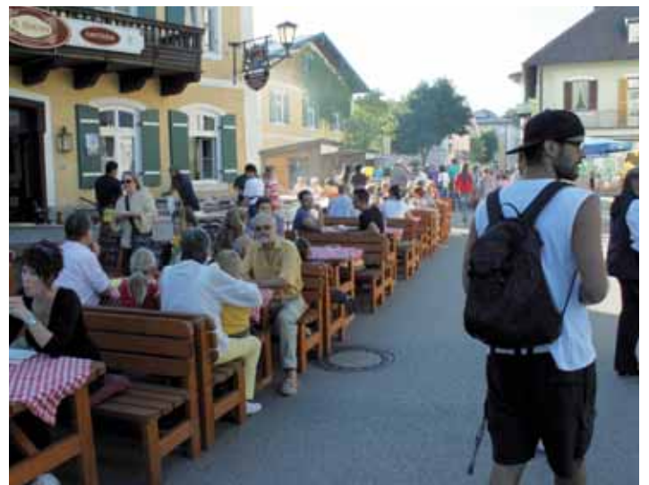
Ein Wohlgefühl wie in Italien. Schlendernd zog es viele Besucher zum Restaurant „Il Sogno“.