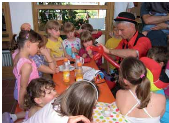
Die bunten Luftballontiere des Zauberers sorgten für heitere Stimmung bei den Kindern.