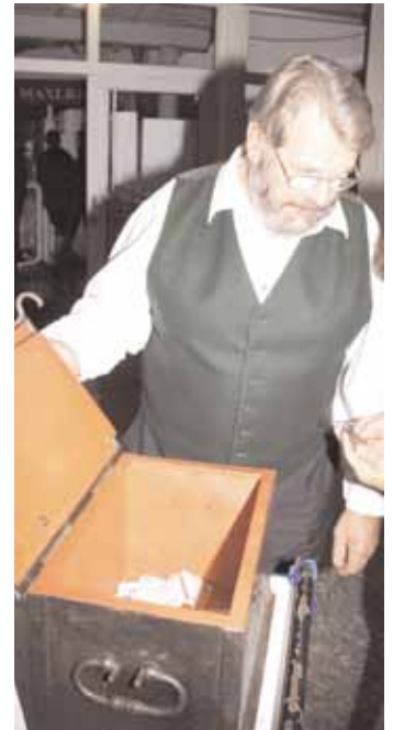
Die historische Gemeindegasse.

Einige Kinder beschlossen spontan eine Sammlung durch die Besucherreihen zu machen – womit sie