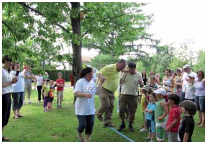
“Slakline” - Ein anspruchsvoller Balance-Kraftakt - auch für die Prominenz.