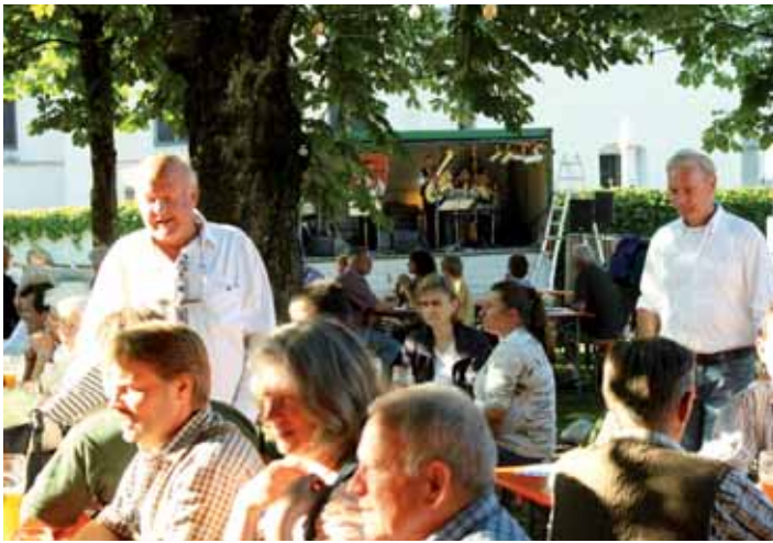
Die Abendsonne und Live-Musik sorgten bei den Festbesuchern für gute Stimmung.