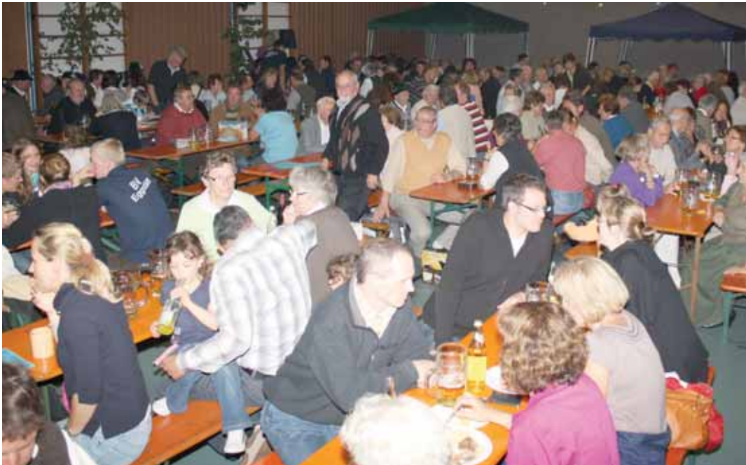
Ausgelassenes Beisammensein in der Hartseehalle.

Außenrenovierung der Kirche - die Idee sprang über!