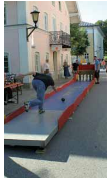
Die Kegelbahn des ASV war eine gelungene Herausforderung für Jung und Alt.

Am Ende konnten sich die Vereine, Einheimischen und Gäste über den stimmungsvollen Sommerabend und einen reibungslosen Festverlauf freuen.