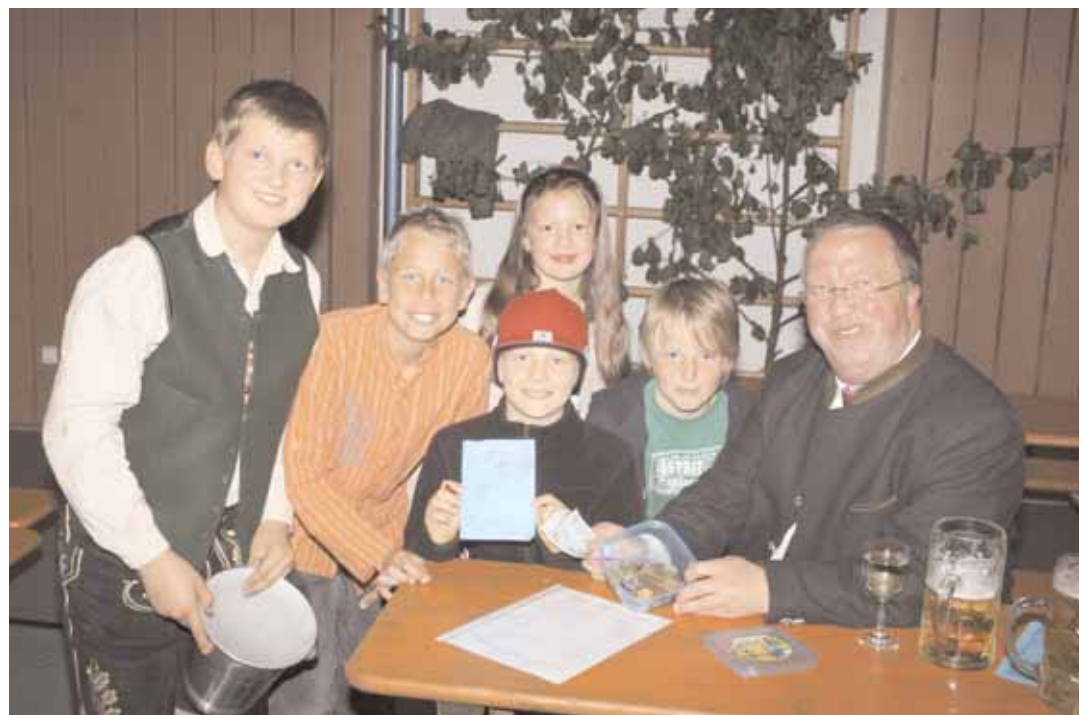
Die Kinder haben mit der spontanen Sammelaktion ihren Teil dazu beigetragen.

durchaus Erfolg hatten. Ein sichtbares Zeichen des Zusammenhalts der Eggstätter für Ihre Kirche! Dabei kam eine stolze Summe von 10.744,82 Euro zusammen. Ein großer Dank geht dabei an den „Vale“ und alle, die so tatkräftig mitgemacht haben.