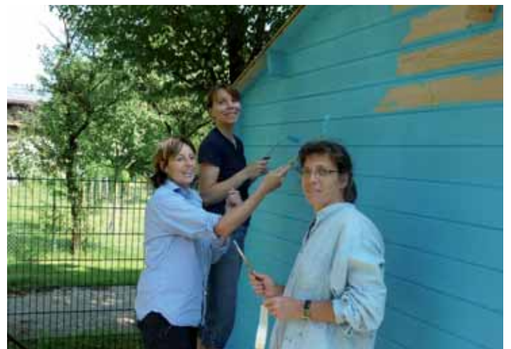
...und die Mamis sorgten für das Make-Up und die gute Stimmung.

Zum Schluss haben die Kinder beim Ponyreiten, Kickern und Edelsteinsuchen - die Erwachsenen beim gemütlichen Ratsch - den Nachmittag ausklingen lassen. Für alle war es ein wunderschönes Fest.