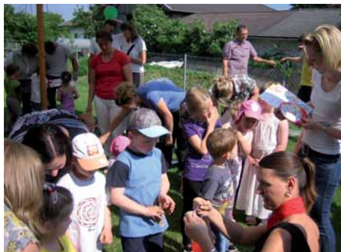
Die große Siegerehrung der kleinen Sportler - für jeden gab es eine Medaille und eine Urkunde.