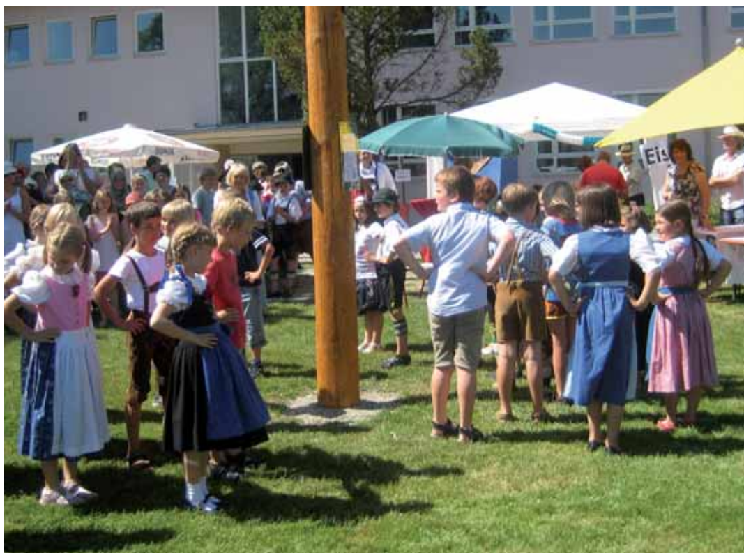
Traditionell in Tracht und mit bester Laune weihten die Grundschüler, bei schönstem Wetter, ihren selbst gestalteten Maibaum ein.

Außerdem war neben kulinarischen Köstlichkeiten jede Menge geboten. Vom Dosenwerfen bis hin zum Maibaum-Nageln ließen sich Schule und Elternbeirat vieles einfallen.