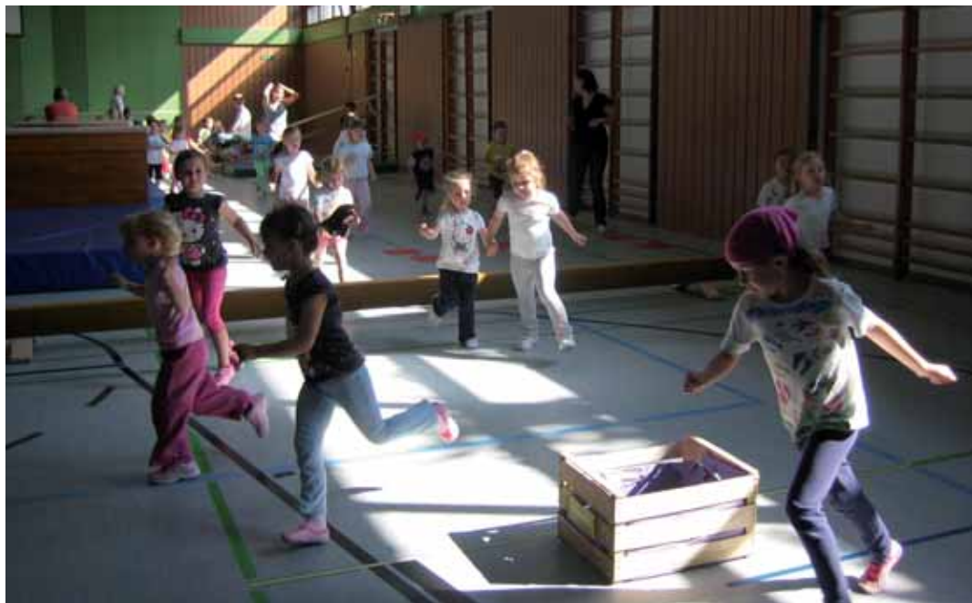
Große Freude beim Hindernisparcours in der Hartseehalle.